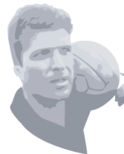
RAMÓN GROSSO FUNDACIÓN